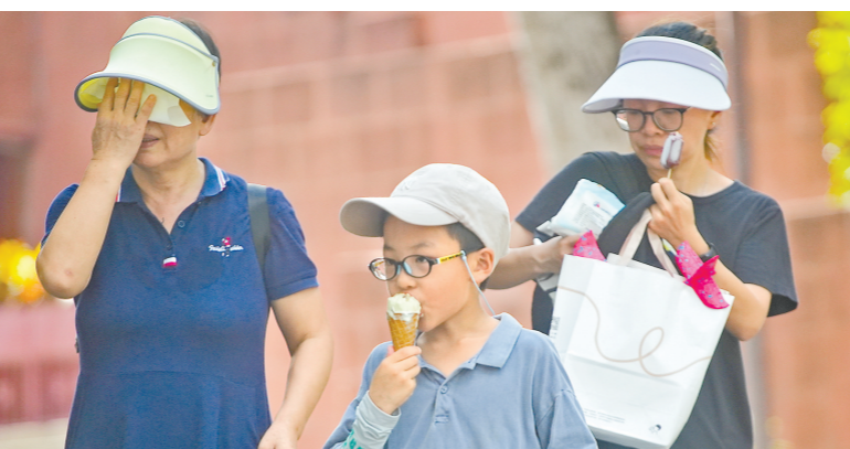
广州街坊避暑各有“招数”