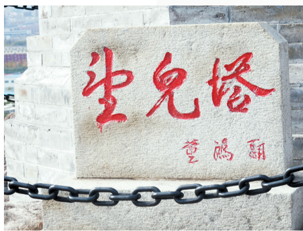
石塔下有“望儿塔”三个大字

山脚下的停车小广场上,竟然还有个母爱文化邮局。这个名称可不是自封的,而是属于中国