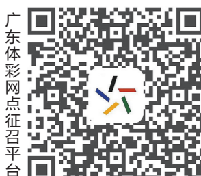
广东体彩网征召平台