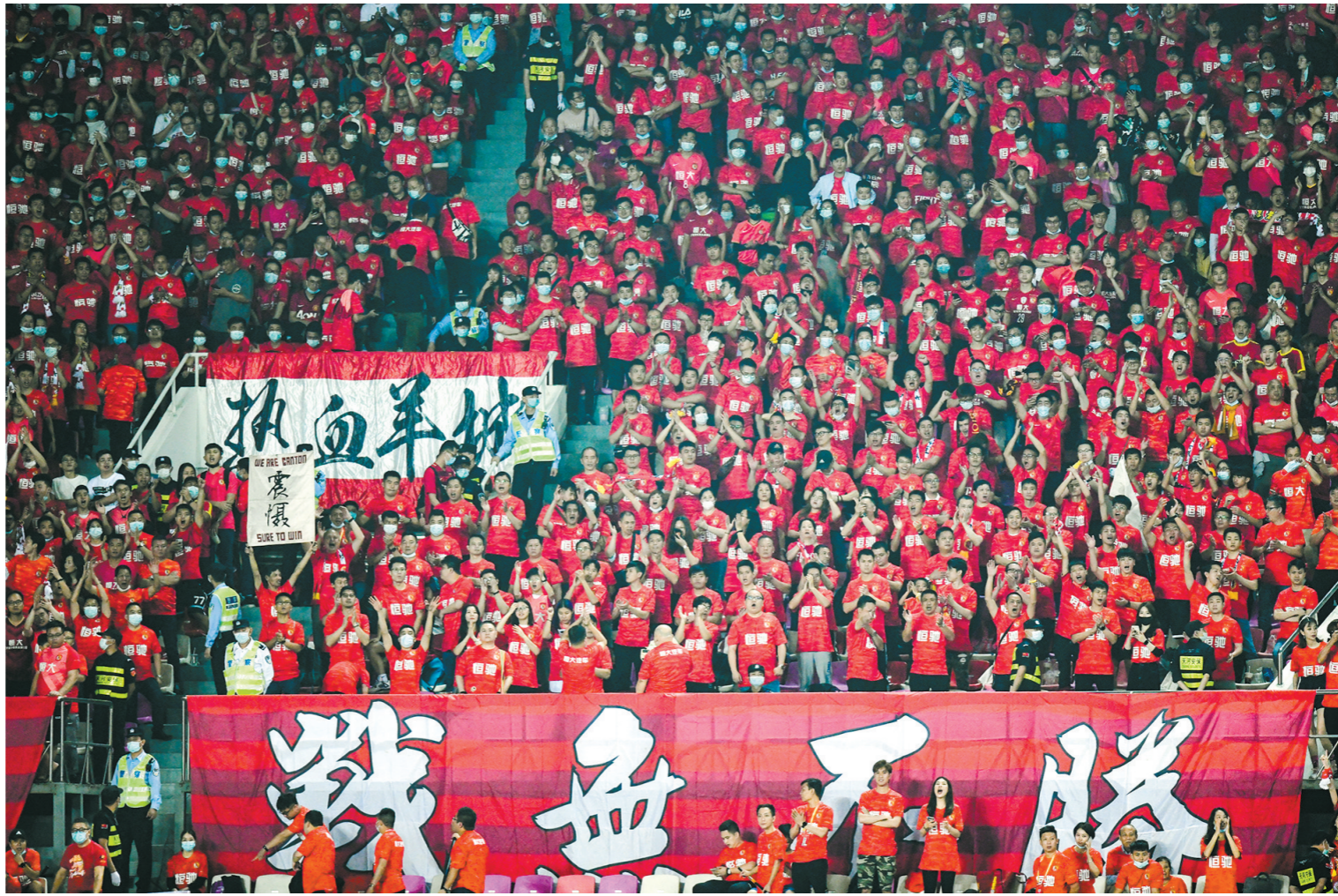
天河体育中心曾经场场满座

在社交平台上,一位头像为广州城队徽的用户提到他最喜欢越秀山的一点,就是坐在看台迎面吹来的轻风,这是越秀山独有的魅力。两年半过去了,越秀山的绿茵未变,广州城队的球迷也在坚定地守望属于他们的蓝色梦想。