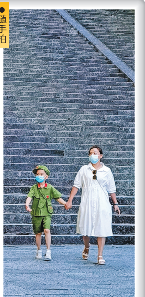
井冈山上 井冈山上 井冈山上

“八一”来临之际，去了井冈山参观。在井冈山革命烈士陵园，看到一位妈妈带孩子拜祭先烈，井冈山精神就是这样一代代传承下来。随手拍专用邮箱:ycwbwyb@163.com