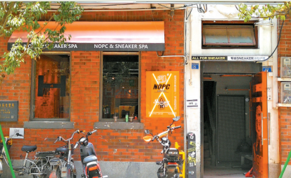
历史建筑活化利用后,开设了特色小店

盐运西红红的石砖下,水磨石米梯旁,又或是生活杂货铺前,街坊们提着菜篮子闲聊家常的样子,便构成一幅悠然的老广州风情画。和很多街区一样,盐运西也得益于近年广州城市更新微改造工程。原住民集中的盐运西,处处体