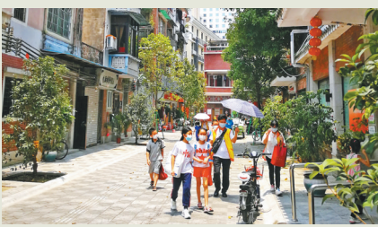
孩子们也可以参加社区服务