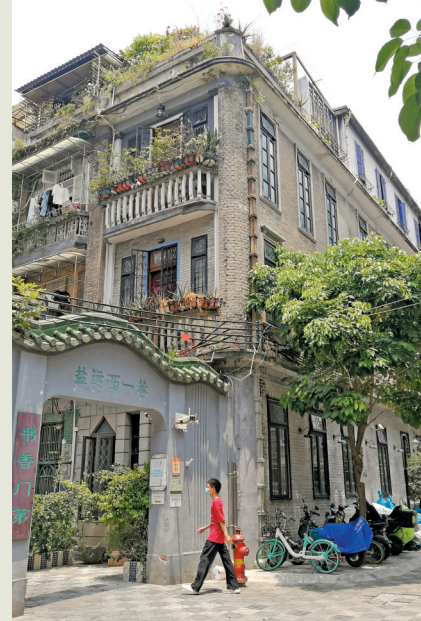
盐运西的历史建筑小洋楼几乎都不重样

街坊们说,社区里凡事好商量,就是沿街种什么树都可以投票发表意见,现在看到的四季桂、白兰树等就是绝大多数街坊的选择。房子已老,街区已老,不老的,是街坊们把日子过得越来越好的心愿。