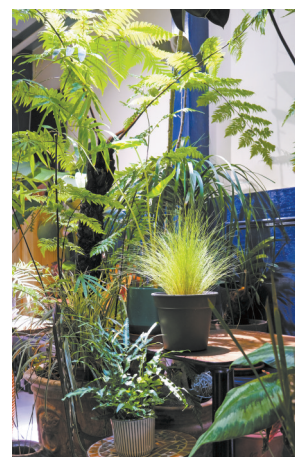
九鸟的绿植生机勃勃

有都市“植男”认为,植物有不同的风格,像外形奇特的仙人掌、块根植物等带来的艺术感、观赏性,不但满足了种植者的收集爱好,也彰显了个人审美,另一方面,在快节奏的时代里,缓慢生长的植物能令人放慢脚步,调节自己的生活状态,让内心回归自然。