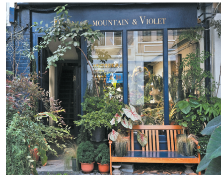
九鸟的园艺店吸引了不少绿植爱好者

“近年居家办公越来越普遍,人们宅家的时间变长,对家居的要求也不断提升。”九鸟认为,这也是都市“植男植女”群体壮大的最大原因。他们活跃在社交媒体和微信群上,分享植物长势、科普养护常识,晒出家居与绿植的搭配... 绿植正成为一种新的消费符号,代表着独特的生活品位。