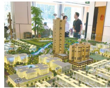
热门区域仍保持热度

广州中原研究发展部预计,由于开发商推货以促回款,近期新增供应将保持高位,预计8月广州可售库存将会进一步增加。