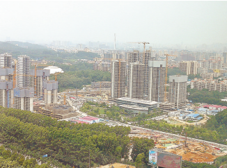
进入8月,包括番禺在内的南部片区新盘开始增多

羊城晚报记者掌握的情况以及专业机构的统计信息显示,8月份起码有17个全新楼盘有推新计划,天河、海珠和白云等区域不乏有高端项目加入战团。从整体情况看,不论是高端楼盘,还是刚性改善型楼盘,它们之间的竞争依然会非常激烈,走量仍是它们的主题。