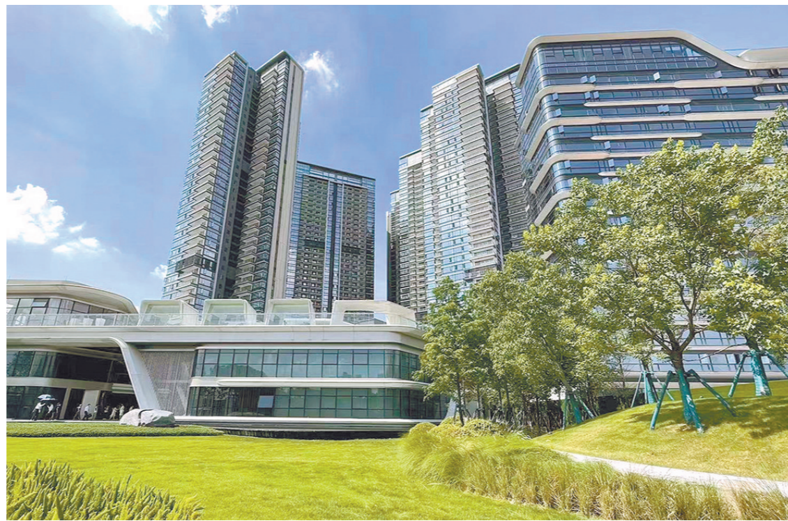
今年中心城区高端项目的成交行情不错

为什么在8月份会出现批量新货?“尽可能变现回笼资金,很多地方还需要花钱,”一位房企营销负责人告诉记者。从市场大背景看,7月以来,国家相关部门及高层会议积极应对市场关切,正有力提振市场信心。例如,7月14日,银保监会表示,要有效满足房地产企业合理融资需求,支持地方政府积极推进“保交楼、保民生、保稳定”;7月28日,中共中央政治局会议指出,要稳定房地产市场,因城施策用足用好政策工具箱,支持刚性和改善性住房需求,压实地方政府责任,