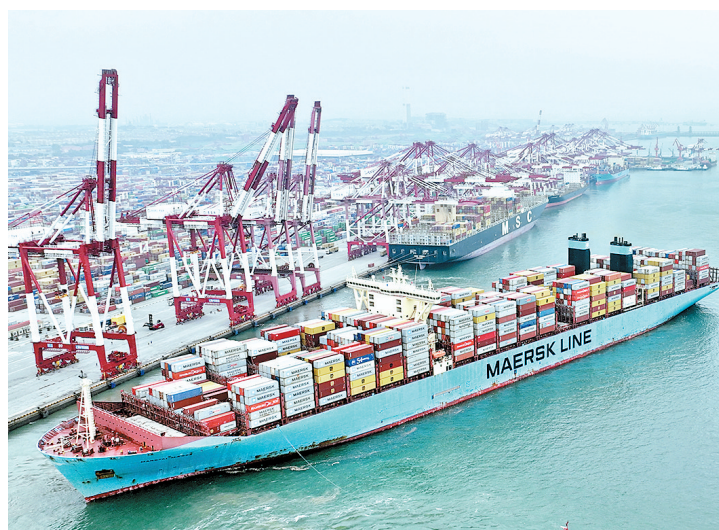
青岛港外贸集装箱吞吐量逆势增长

新华社电 23.6万亿元——7日，我国货物贸易进出口交出前7个月“成绩单”。从累计增速看，前7个月同比增长10.4%；从月度看，7月份同比增长16.6%，传递出我国经济持续恢复的积极信号。