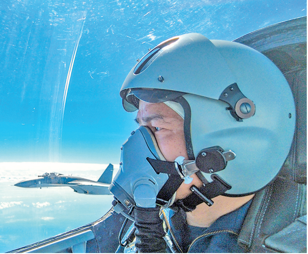
8月7日，中国人民解放军东部战区按计划，继续在台湾周边海空域进行实战化联合演训。这是战机正在进行编队飞行

新华社电 7日，中国人民解放军东部战区按计划，继续在台湾周边海空域进行实战化联合演训，重点检验联合火力对地打击和远距离空中打击能力。