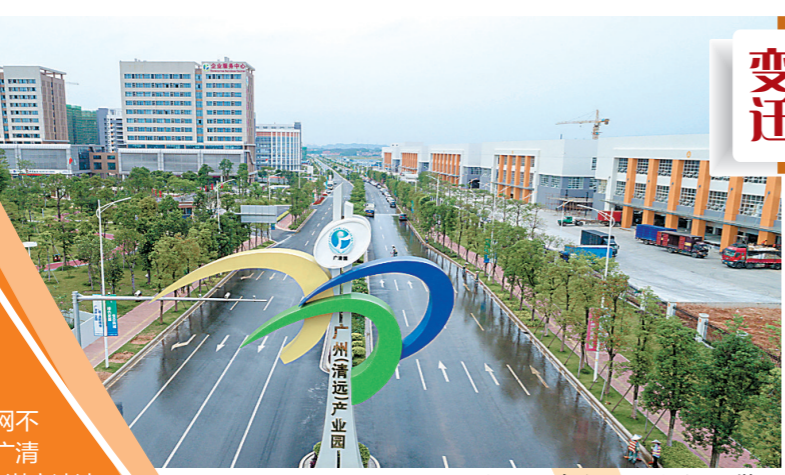
如今的广清产业园