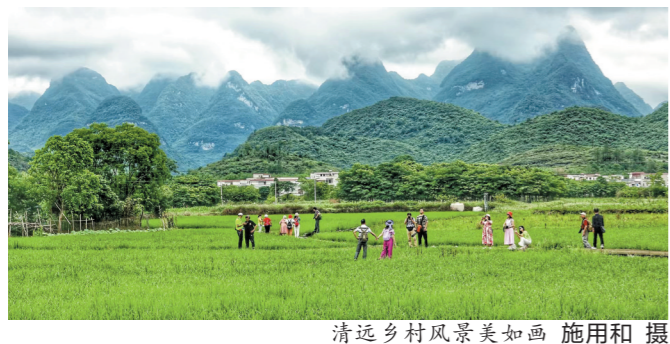
清远乡村风景美如画