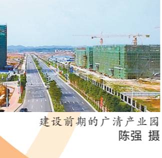
建设前期的广清产业园

企业办事不用走出园区。 近年来，清远聚焦市场主体开办、运营、退出全流程各环节的痛点难点问题，进一步优化营商环境，持续释放市场活力。今年5月，广清不动产登记、税务、登记“跨城办”事项正式落地。7月21日，广清产业园不动产登记便民服务窗口启用，这是广东省首个在工业园区设立的不动产登记便民服务窗口，实现“让数据多跑路，让企业少跑腿”。 紧跟广州营商环境4.0经验，广清产业园构建“一门受理、一站服务、一网监管”的全天候、全方位服务体系。目前，企业商事登记、房地产权登记、公积金互贷等60余项便民事项实现跨城办理。 当前，广清产业园全力争当广清一体化高质量发展的排头兵，打造清远先进制造业发展的集聚地，建设全省产业转移和产业共建的示范区。