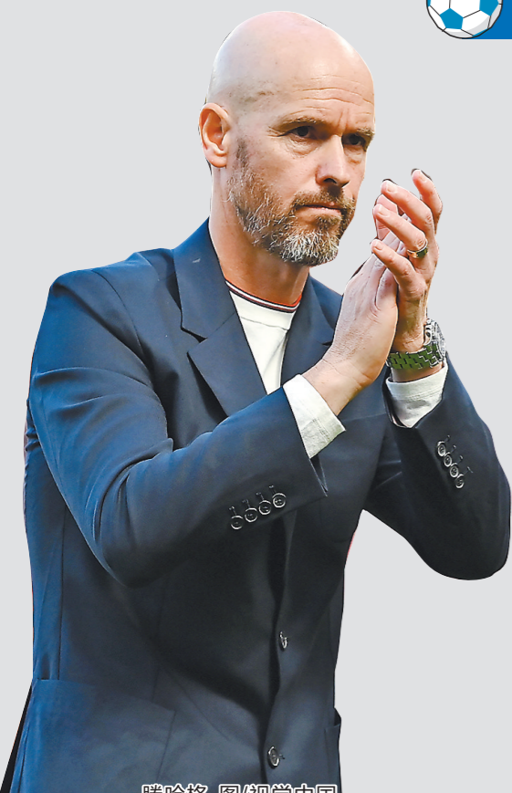
滕哈格 图/视觉中国