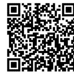
扫码可查询“穗好办”政务服务事项清单内容

此外，《清单》还包括了1556项“自助办”事项，打通了服务群众的“最后一公里”，提供了7×24小时“不打烊”服务。据悉，广州目前已在市部署了近5000台政务服务自助终端，基本覆盖全市各区、镇（街）、村（居）。政务服务自助终端包括政务服务一体机和银行智慧柜员机，群众可以通过政务一体机办理个人名下房产查询、个人完税证明打印、港澳台签证申请、驾驶员和车辆违章查询、社保缴费明细查询和打印、医保参保明细查询和打印等高频政务服务事项，也可以通过银行智慧柜员机办理住房公积金、社保、医保、民政、残联等近百项政务服务事项。2021年政务服务自助终端业务量超过200万笔。