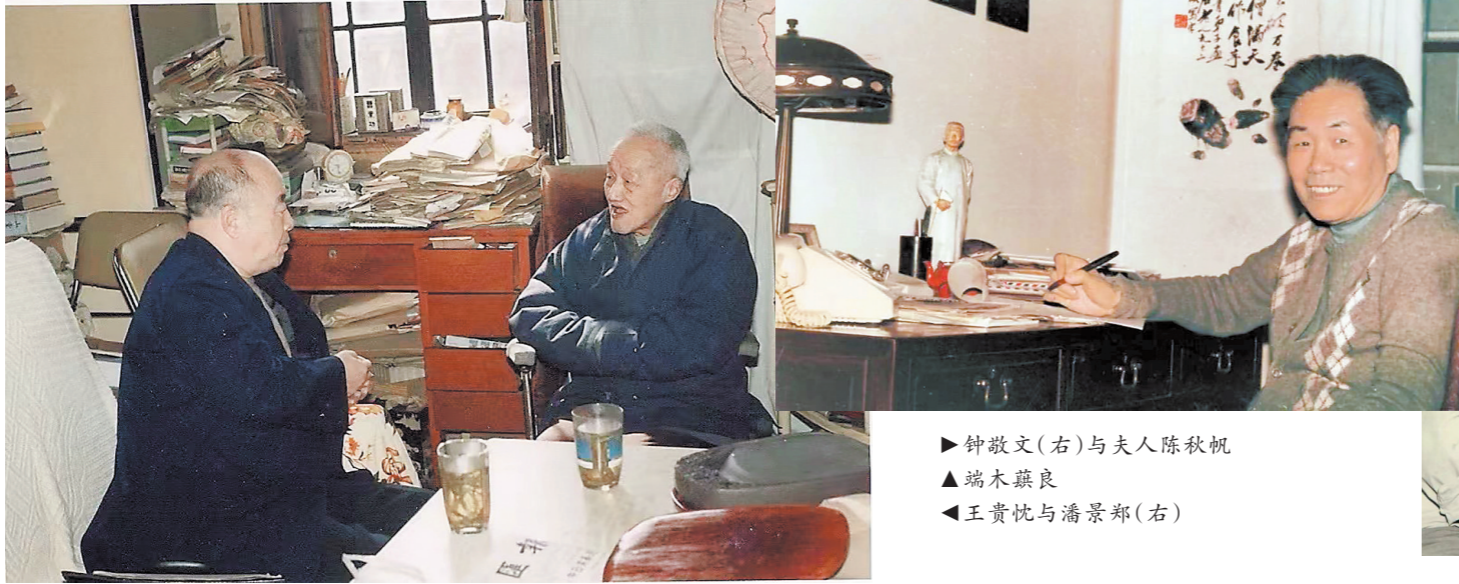
▶钟敬文(右)与夫人陈秋枫 ▲端木蕨良 ▼王贵忱与潘景郑(右)

“学人墨迹丛书”旨在发掘近世以来学人的书法、手稿,整理出版未刊稿,在保存前辈学人书法手迹的同时,将其学术发明化身千万,供读者欣赏,供学者研究。该系列自2018年6月出版第一本《台静农》以来,陆续推出了《楚图南》《谢稚柳》等册,受到收藏界、学界关注。