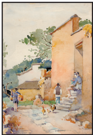
水彩画作《故乡》(其一)