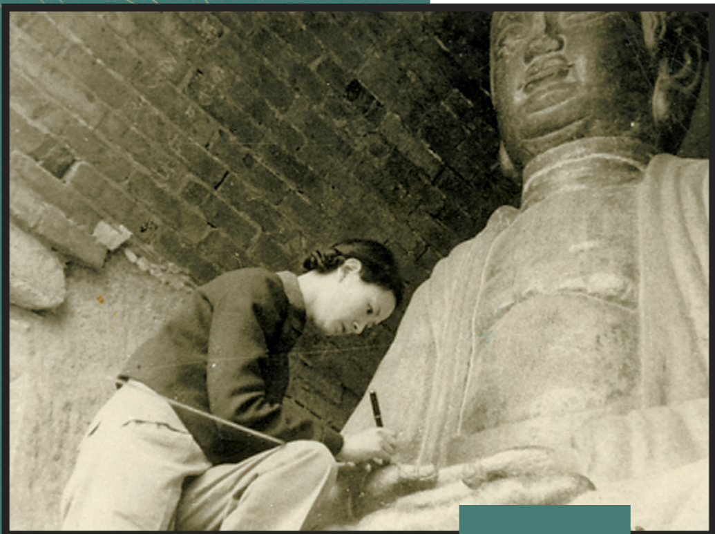
1937年测绘陕西耀县药王庙

近日，由北京出版集团文津出版社出版的《林徽音先生年谱》（以下简称《年谱》）一书正式面市。该书是国内第一部系统梳理、扎实考证林徽音生平的著作，也是建筑史学家曹汛先生二十余年心血的集结。 “肩头上先是挑起两担云彩，带着光辉要在从容天空里安排。” 这是“一代才女”林徽音抗战期间在李庄所作的诗句，概括的也是她的一生——肩挑起建筑和文学这“两担云彩”，将二者同时作为毕生的事业与追求。 但比起林徽音在建筑和文学上的成就来，坊间却常对她的某些情感生活片段津津乐道，甚至任意铺排，将其作为“流量密码”引人流连。互联网场域下，一个真实的林徽音日渐模糊。 值得庆幸的是，该《年谱》全面梳理了林徽音对中国建筑学所作的贡献，同时从建筑学修养透视她的诗文创作，从名门才女的光环下还原她刻苦耐劳的人生，令一个个多维度的林徽音形象展现在读者面前。