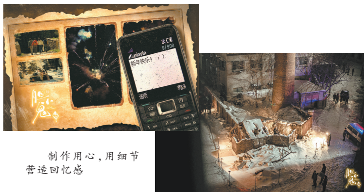
制作用心,用细节营造回忆感