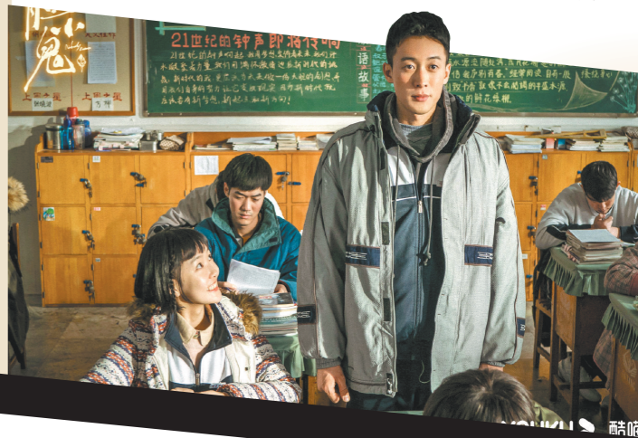
郑执写小说时的遗憾,前三集的青春叙事弥补了