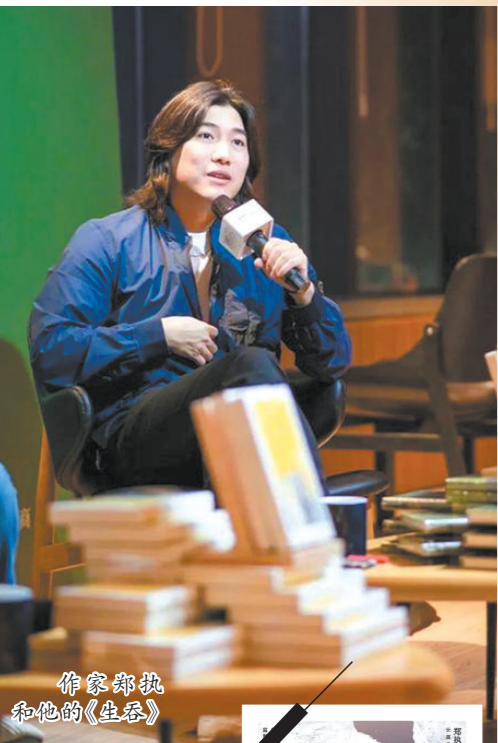
作家郑执和他的《生吞》

有这样一批出身东北的80后作家,他们不仅是文学圈中颇受瞩目的新星,也是近年IP影视改编的香饽饽。双雪涛的《平原上的摩西》《刺杀小说家》已经被拍成电影,班宇的《逍遥游》也在去年10月曝光了电影概念预告。还有郑执,他的早期作品《我在时间尽头等你》以及获奖短篇小说《仙症》已经被改编为电影,而其最为人们熟知的小说代表作《生吞》也被改编成悬疑剧《胆小鬼》,最近在优酷播出。