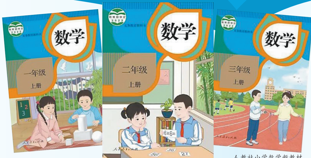
人教社小学数学新教材

记者22日从教育部获悉,按照教育部要求,人民教育出版社(以下简称“人教社”)从5月下旬启动并于日前完成小学数学教材插图重绘工作,将全力确保2022年9月新学期课前到书。下一步,教育部将进一步拓宽渠道,广泛听取一线教师、学生和家等方面的意见建议,健全日常修订机制,不断改进完善教材。