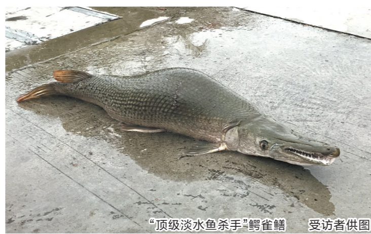
“顶级淡水鱼杀手”鳄雀鳝

随着国家对外来物种管理越来越重视，目前呼吁大家不要再养鳄雀鳝这类大型凶猛物种。如果市民购买后要弃养，千万不要人为放生，可以委托高校、科研机构、相关部门进行处