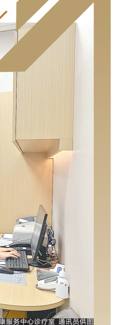
港澳居民(广州)健康服务中心诊疗室

承中国花鸟画美学思想,展蛇紫嫣红时代精神。8月28日,《蛇紫嫣红·时代意象——中国国家画院花鸟画主题创作学术邀请展》在广州画院美术馆拉开帷幕。展览将持续至9月21日。本次展览以“当代花鸟画在新时代背景下的主题性创作研究”为中心,汇聚全国代表性花鸟画家上百人,其中分老、中、青三个板块,每个板块各40余幅,共展出140余幅作品。参展作品以大尺幅及画家的代表作为主体。首次采用数字展厅形式呈现花鸟画大展。