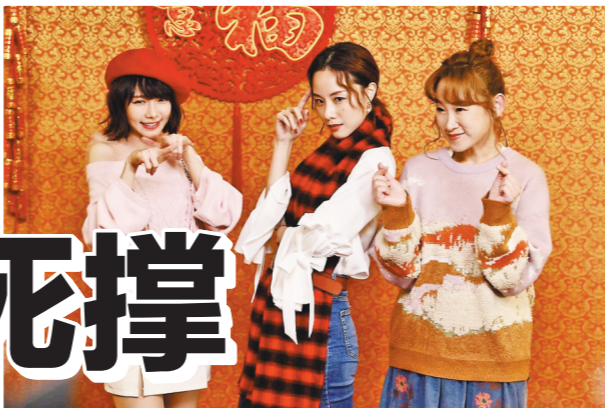
女性角色有些单薄

《还是觉得你最好》是一个爱情故事吗?是一个爱情故事吗?我觉得都不是。在我看来,这是一个成长故事,而且是一个中年男人的成长故事。