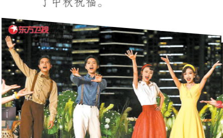
东方卫视中秋晚会现场