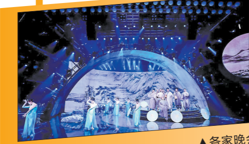
各家晚会各具特色