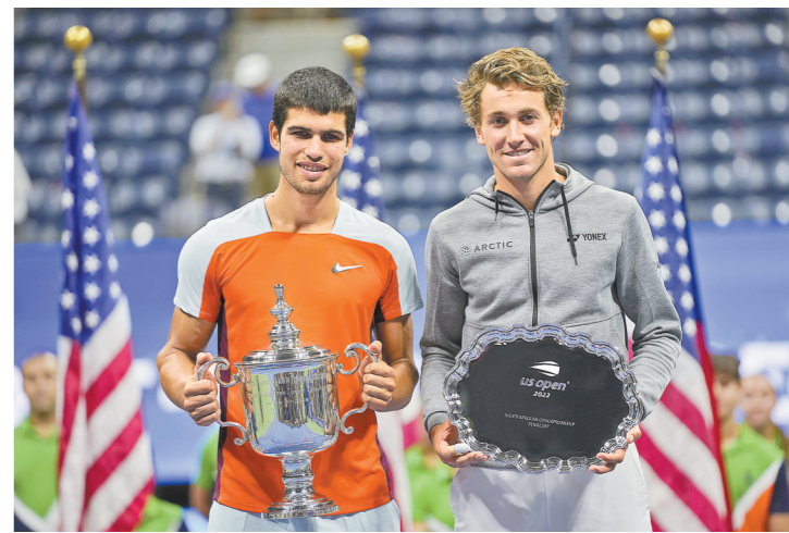
阿尔卡拉斯(左)和鲁德在颁奖仪式上合影

羊城晚报讯 记者龙希报道：天才少年阿尔卡拉斯圆梦夺冠，成为首位“00后”男单大满贯冠军！昨天在2022年美国网球公开赛男单决赛中，3号种子、19岁的西班牙选手阿尔卡拉斯以3比1战胜5号种子、挪威名将鲁德，职业生涯首次赢得大满贯冠军，并成功登顶男单世界第一。