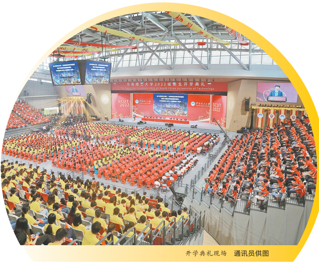
开学典礼现场

羊城晚报讯 记者陈亮、实习生刘宇、通讯员华轩报道：9月13日，华南理工大学2022级新生开学典礼在广州国际校区举行。本次典礼在三校区设了3个主会场、96个分会场，共14000余名新生参与，并采用直播方式，吸引全球广大校友、学生家长、社会友人32万人次共同在云端观礼。