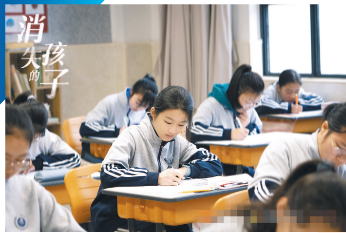
00后演员刘琪琦饰演的许恩怀总是心事重重