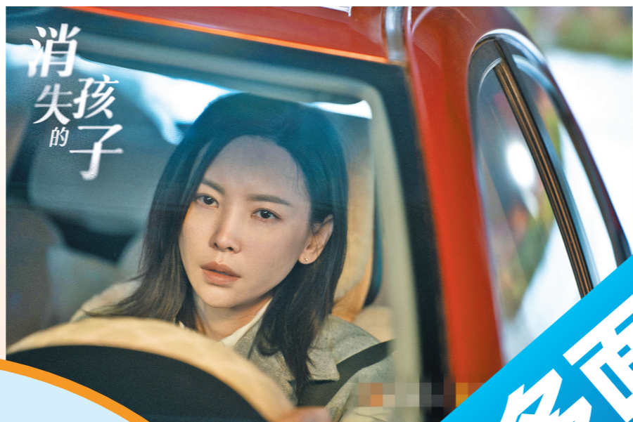
于文文饰演表面柔弱内心强大的林楚萍