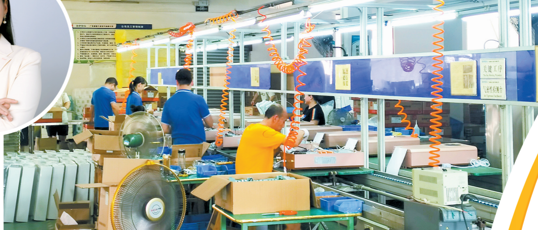
大派电器工厂内景