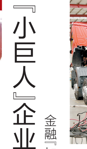
永强奥林宝生产车间