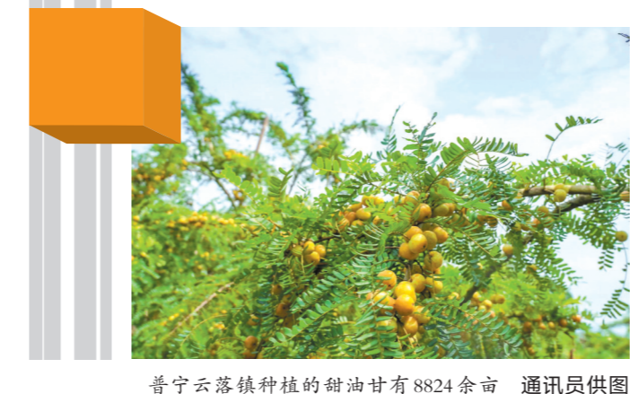
普宁云落镇种植的甜油甘有8824余亩

一直以来,梅州市委、市政府把“三农”工作摆在重中之重位置,让“农业强、农村美、农民富”的美好愿景变为生动现实。目前,梅州全市累计创建1个国家级优势特色产业集群,1个国家级、25个省级现代农业产业园,148家省级以上农业龙头企业,数量居全省第一。86.3%村集体经济年收入达到10万元以上,农村居民人均可支配收入稳步增长。 此外,梅州农业品牌建设亮点纷呈,全市共有“粤字号”农业品牌目录产品217个,全国名特优新农产品24个,省特优农产品优势区11个,粤港澳大湾区“菜篮子”生产基地及加工企业104个,绿色认证企业74家,农产品地理标志19个。