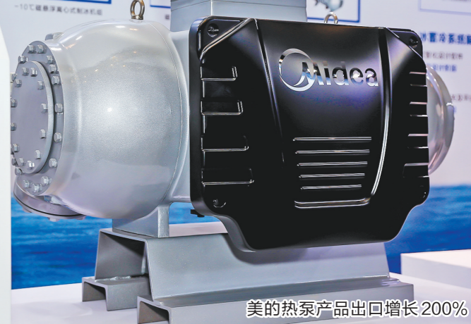
美的热泵产品出口增长200%

记者了解到，美的集团已抢先布局绿色智能家电换新，在全广东范围内启动开展“绿电行动”，计划发放20万张绿色家电优惠券，同时提供在线评估旧机残值及上门回收服务，另推出专项以旧换新补贴，最高达600元。据透露，截至目前，广东已有超2000家各类线下门店启动相关活动宣传。