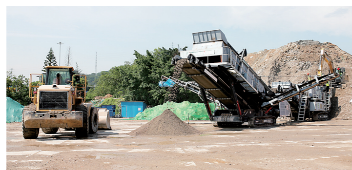
建筑废弃物处理现场

公开数据显示，目前，广州全市建筑垃圾排放申报核准率达97%，合法收运率达99%，安全处置率达100%，综