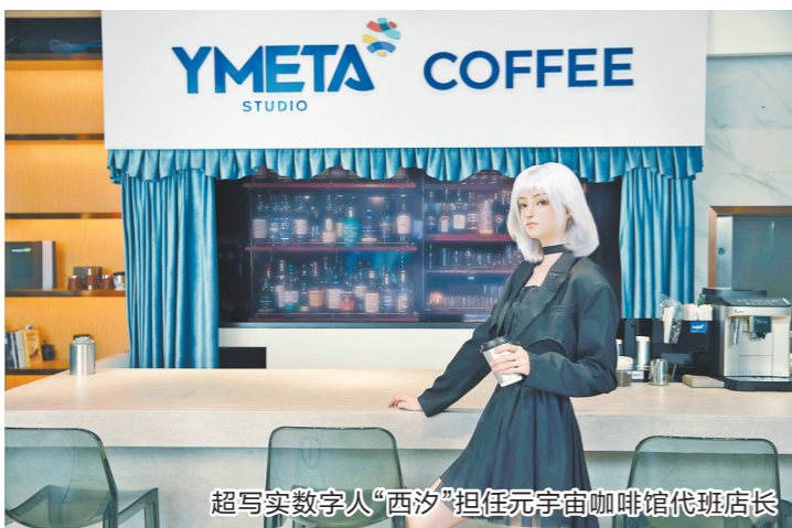
超写实数字人“西汐”担任元宇宙咖啡馆代班店长

“用丰富的内容将人设和世界观打造为一个可信的虚拟人，我们一直在布局。我们还积累了虚拟内容生产所需专利技术，公司拥有智能动画制作管理系统，研发了毛发、流体解算等应用插件，有效提升虚拟内容生产效率。”阎冰介绍，专业的制作能力和IP孵化的长期主义，将是咏声动漫在元宇宙和虚拟人赛道中脱颖而出关键：“元宇宙催生了大量对数字动漫产业链条有需求的市场。当人才和资本都聚集到赛道中，就会产生新的业态。”