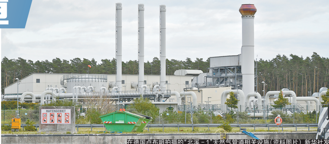
在德国卢布明拍摄的“北溪-1”天然气管道相关设施(资料图片)

俄罗斯向欧洲输送天然气的两大海底管道“北溪-1”和“北溪-2”26日均检测到漏气状况，运营方表示“正在调查原因”。 这两条管道，一条8月底以来暂停送气，一条完工后未投入运营，所以漏气对当前欧洲天然气供应状况并无直接影响，只是加剧了俄欧之间的紧张气氛。