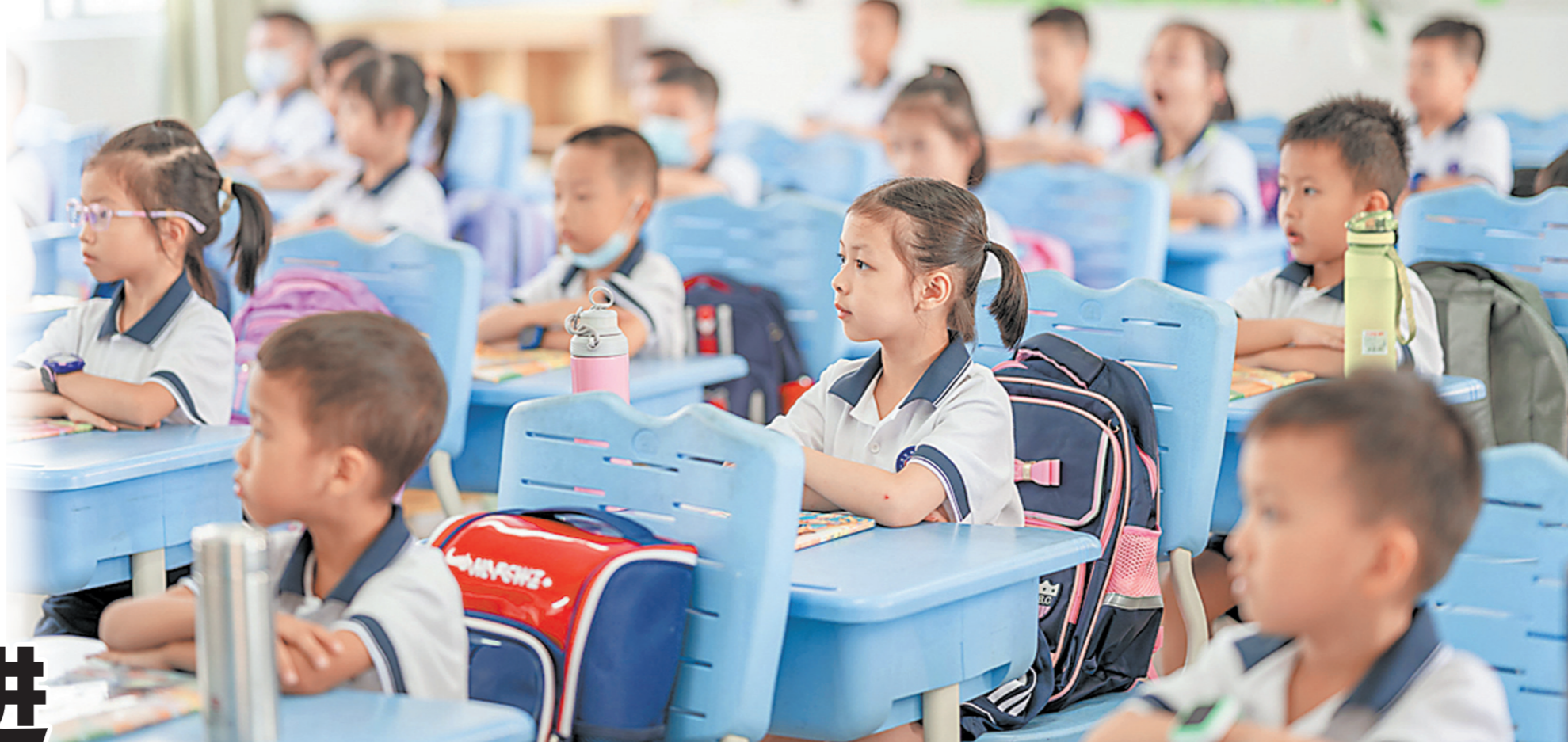
茂名愉园小学学生精神饱满上开学第一课 资料图片