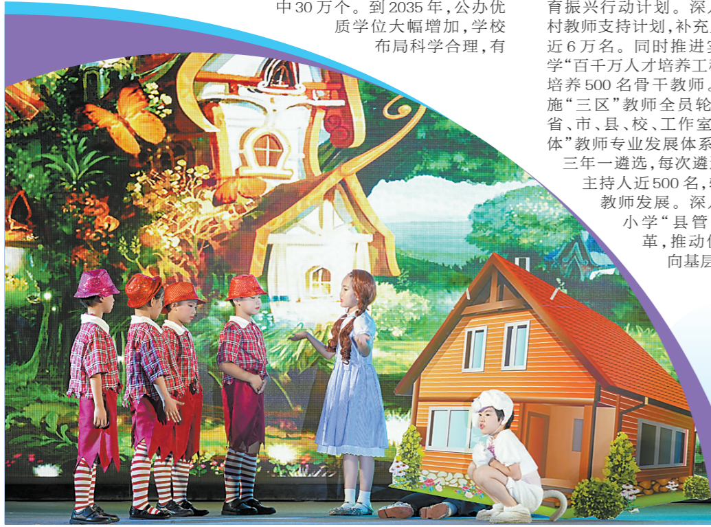
广东实验中学荔湾学校第一小学部第一届话剧节快乐上演

羊城晚报:接下来广东基础教育高质量发展将会有哪些新举措? 李璧亮:“要深入推进‘双减’工作落到实处。包括大力推