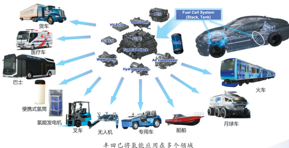
丰田已将氢能应用在多个领域

加入的是氢,排出的是水!被称为“终极环保车”的MIRAI,能够在行驶过程中净化空气实现“负排放”。MIRAI车内共有三个氢气罐,氢气总搭载量为5.6kg。同时,该车通过FC升压变器中使用SiC半导体,采用锂离子低压蓄电池等方式,降低系统能耗损失,实现了WLTC工况最高续航里程约850km,较上一代车型提升约30%。