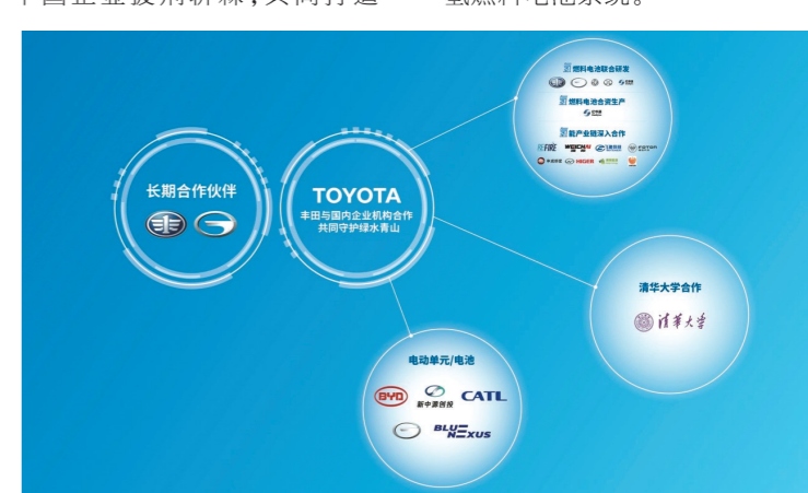
丰田与众多合作伙伴一起推动氢能发展

产品方面,2021年10月,丰田汽车携手中国合作伙伴联合开发及生产的首款商用氢燃料电池系统产品TL Power 100正式发售;2022年8月,面向轻型商用车市场的TL Power 80也投入市场,这是继TL Power 100之后,第二款面向中国商用车市场需求,在中国研发生产的氢燃料电池系统。