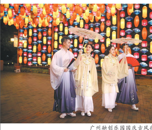
广州融创乐园国庆古风夜间游园会