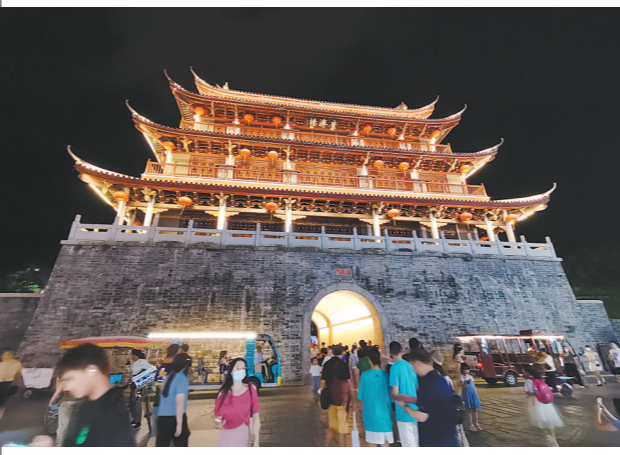
潮州广济楼牌坊一带,夜游客络绎不绝