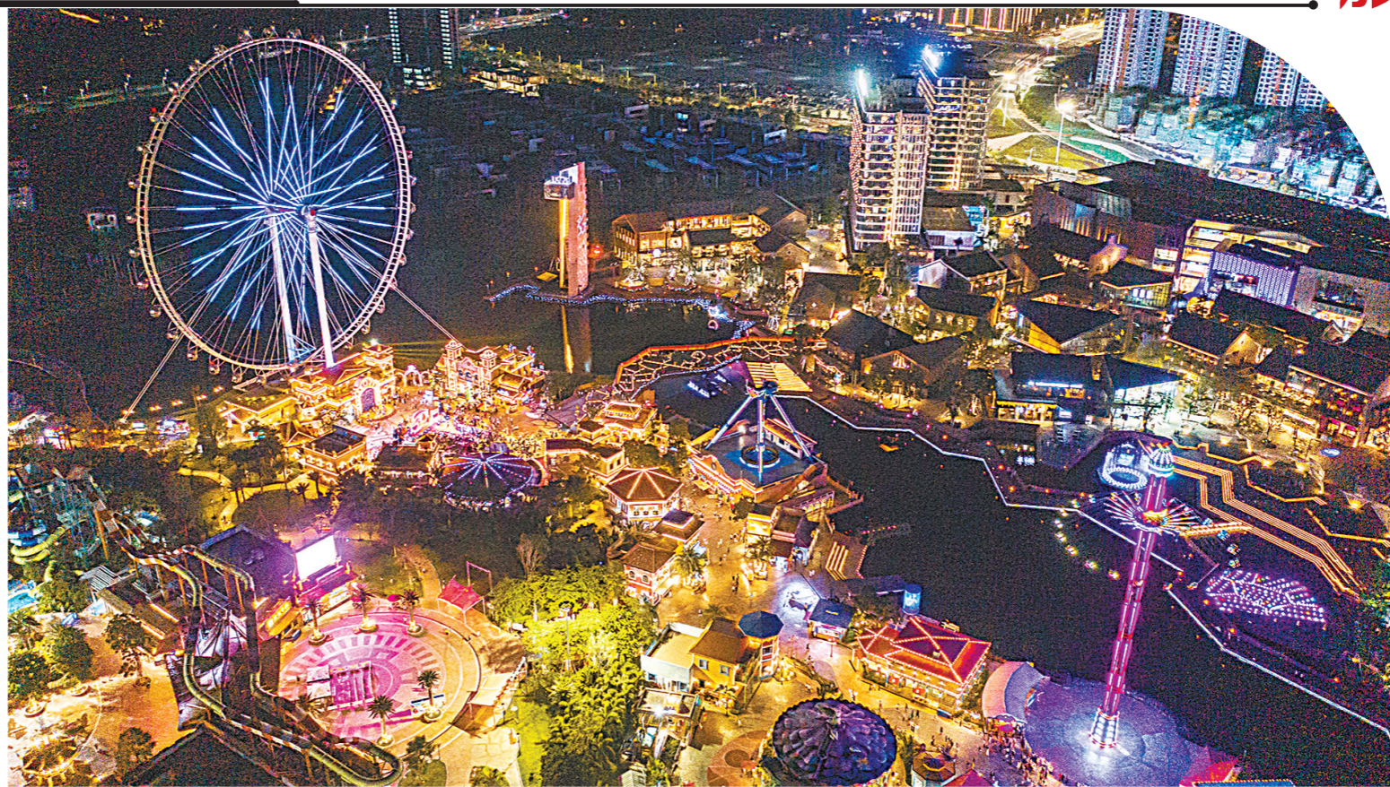
顺德欢乐海岸PLUS夜间文旅体验丰富多彩