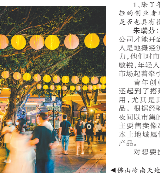
佛山岭南天地以打造“沉浸式”夜游体验闻名