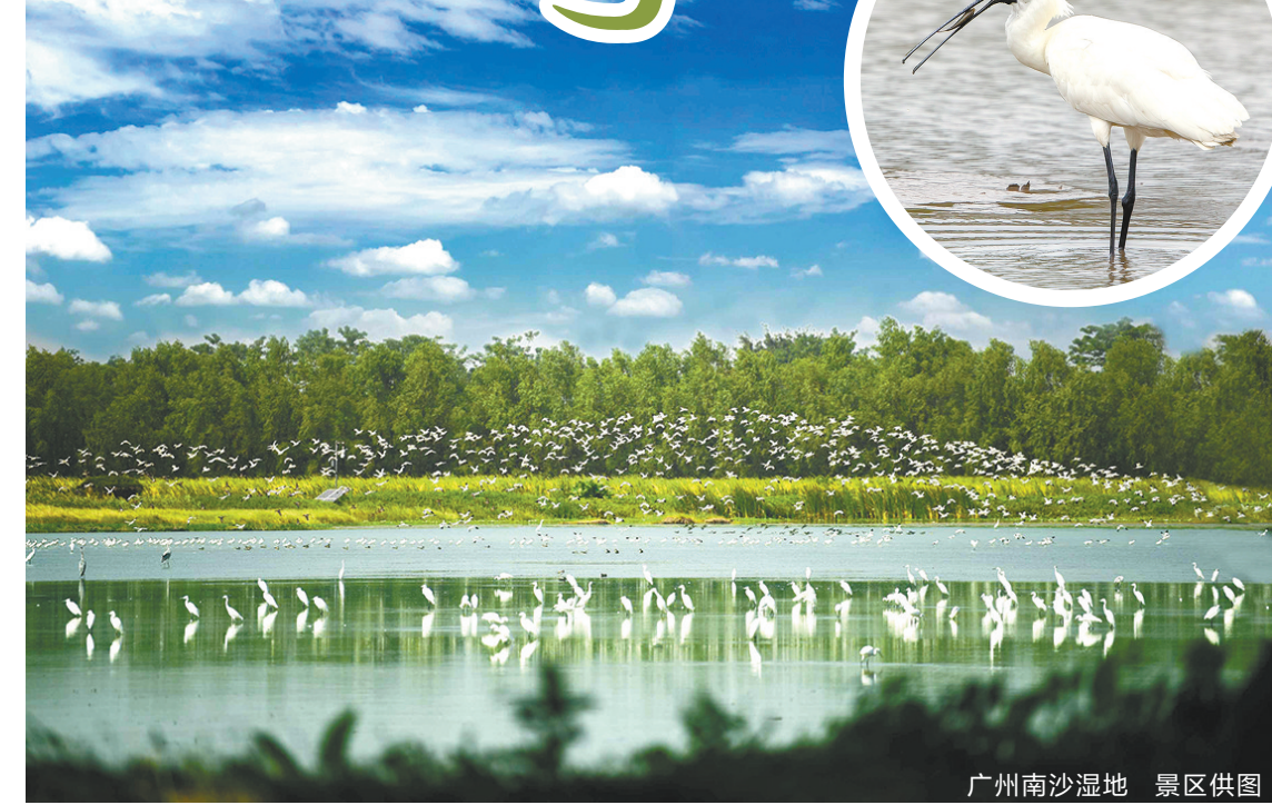
广州南沙湿地