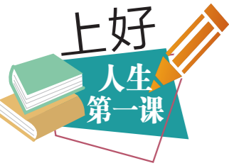
羊城晚报记者 何宁

有些孩子在家里表现好，但去幼儿园总是与小朋友相处不好；有些孩子在家各种霸道，但是在幼儿园却表现很好。这到底是怎么回事呢？