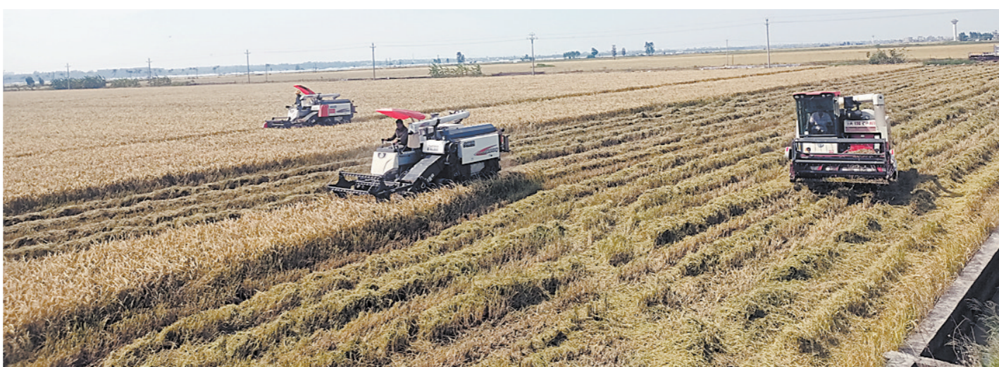
湛江超额完成农业生产任务