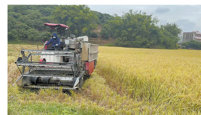
农技合作社抢收水稻

收完水稻种冬粮 茂名各地农业农村局加强全面协调管控，深入一线指导，就地解决农资运输、农机作业等问题，全力保障农民正常下田；鼓励当地的合作社、