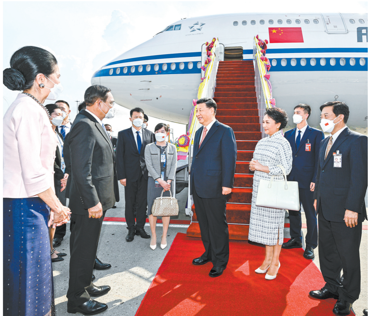
当地时间11月17日下午，国家主席习近平乘专机抵达泰国曼谷，出席亚太经合组织第二十九次领导人非正式会议并对泰国进行访问。这是习近平和夫人彭丽媛乘坐的专机抵达曼谷素万那普国际机场时，泰国总理巴育夫妇、副总理兼外长敦夫、文化部部长伊提蓬夫妇等热情迎接。