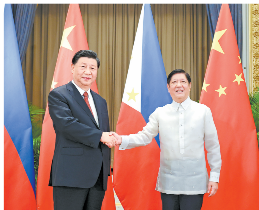
当地时间11月17日下午，国家主席习近平在泰国曼谷会见菲律宾总统马科斯。

新华社电 当地时间11月17日下午，国家主席习近平在泰国曼谷会见菲律宾总统马科斯。