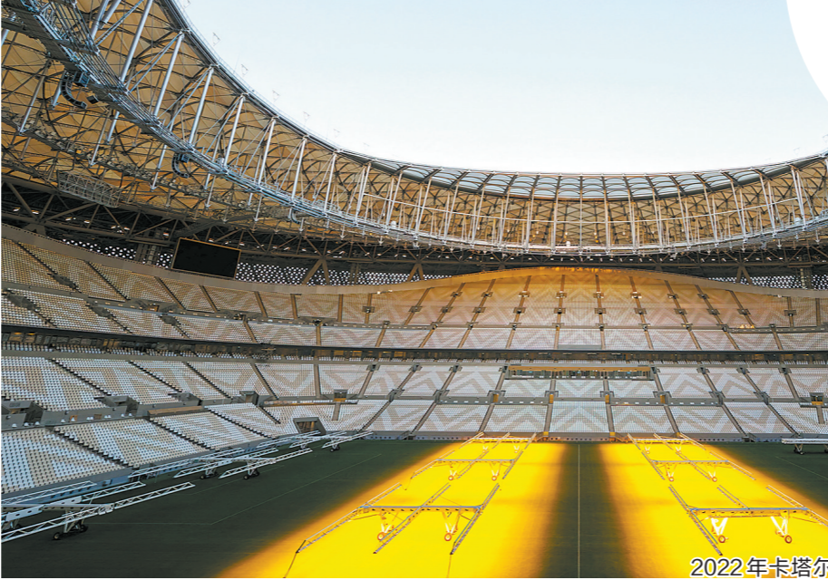
2022年卡塔尔世界杯卢赛尔体育场