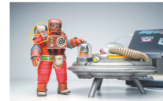
黑板的宇航员模型莱卡与洛夫夫