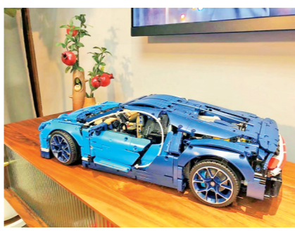
大胆儿的积木布加迪