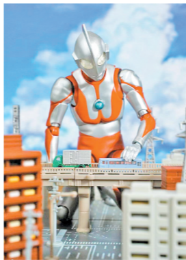
黑板的奥特曼手办