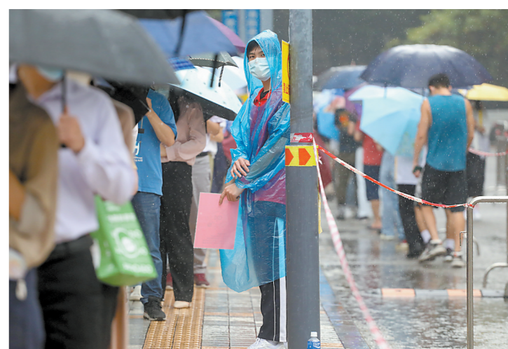
户外防疫需防御降雨降温

羊城晚报讯 记者梁泽韬,通讯员张东、王天巍报道:11月22日是二十四节气“小雪”到来的日子。在“小雪”节气到来前一天傍晚前后,东南气流将南海的对流云系“吹”入广东,部分地方出现阵雨天气。气象部门预计,受偏南气流和弱冷空气影响,广东将在未来一段时间降下“小雪之雨”,各地居民需关注降雨降温对生活工作的影响;参与防疫工作的工作人员及相关单位,也需要留意降雨降温对防疫工作的影响。