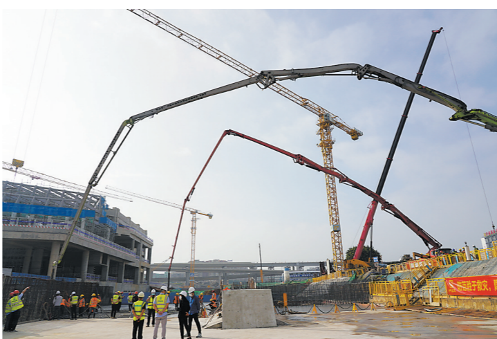
工程现场

羊城晚报讯 记者徐振天,通讯员李楠、鲁怀琦报道:近日,记者从施工方获悉,由广州地铁集团负责建设的广州白云站综合交通枢纽一体化建设工程(以下简称“广州白云站”)地铁预留工程已顺利封顶。 广州白云站地铁预留工程位于白云区石槎路,基坑最大深度为35.9米。项目周边环境复杂,临近既有地铁八号线及220千伏电力隧道,与白云火车站站房工程、芳白城际线明挖段、白云站配套场站及配套设施道路等在建设项目存在交叉施工影响,对现场施工及风险控制要求极高。 广州白云站综合交通枢纽是广州枢纽“五主四辅”客运站之一,是广州市首个按现代综合交通枢纽规划建设理念打造的特大型枢纽工程,未来将引入京广普速铁路、京广高铁、广湛高铁等线路,同步配套六条地铁线路、长途车场站、公交车场站等多种交通接驳设施及