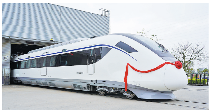
珠三角城际铁路首批2列四编组动车组交付

羊城晚报讯 记者徐振天，通讯员张志南、蔡湘璇报道：11月23日，记者从广东珠三角城际轨道有限公司了解到，目前珠三角城际铁路首批2列四编组动车组已实现交付。