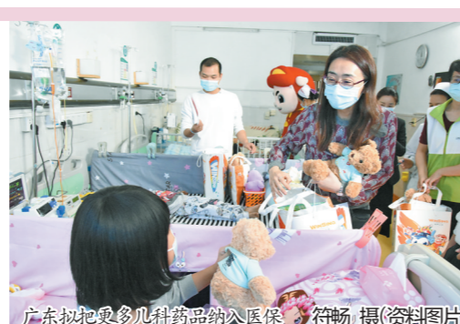
广东拟把更多儿科药品纳入医保