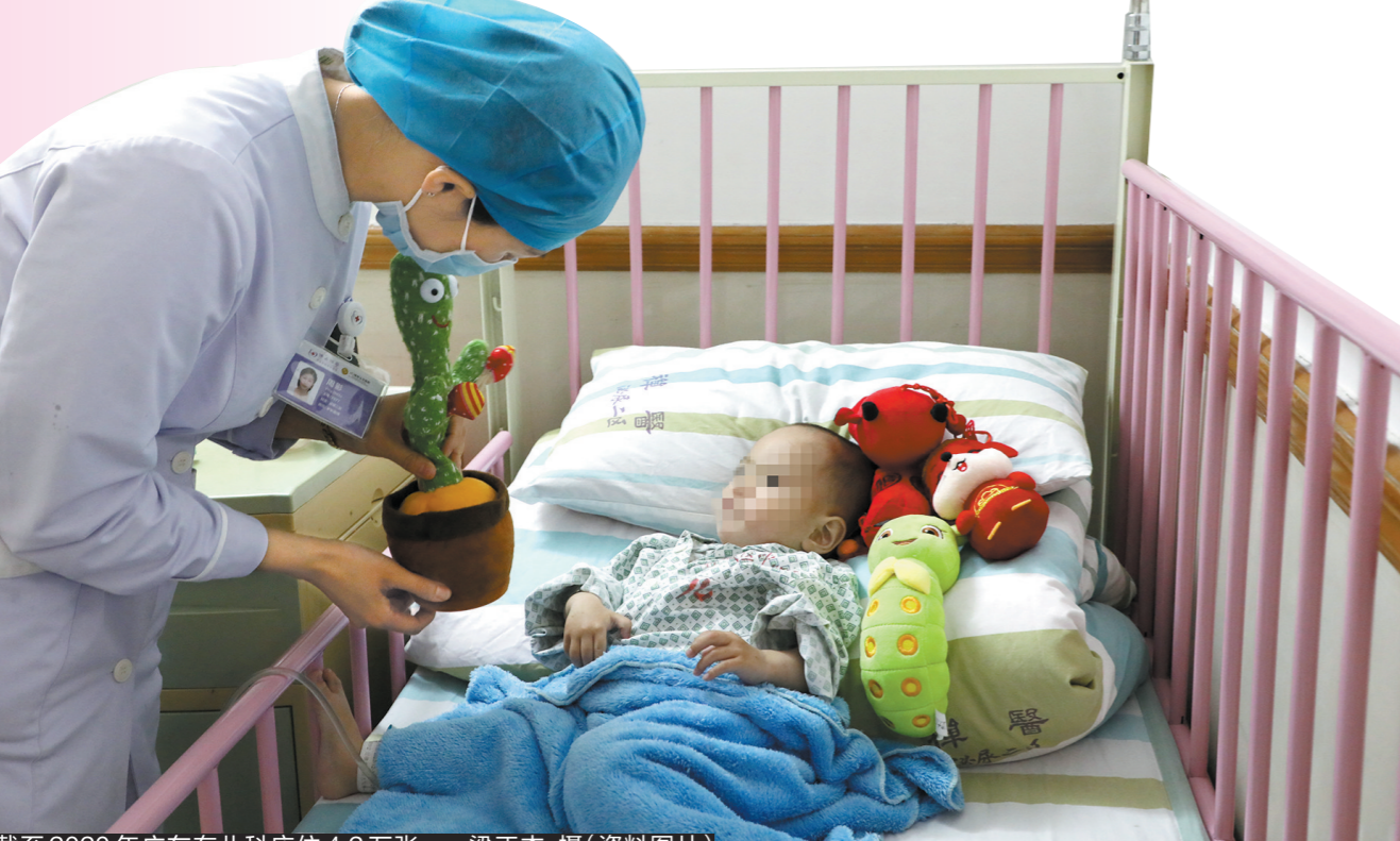
截至2020年广东有儿科床位4.2万张

随着三孩生育政策的出台，广东新生儿将每年增加60万-80万人。省政协委员陈严指出，广东医疗卫生系统中存在儿科医生人数增长较缓、相关配套设备不齐全、医保报销环节亟待优化等问题，未能与三孩生育政策形成配套。陈严在今年省两会上提案建议优化医保制度，提高儿科病人的支付定额和儿科医生待遇，多层次推进儿童重症监护病房的建设。