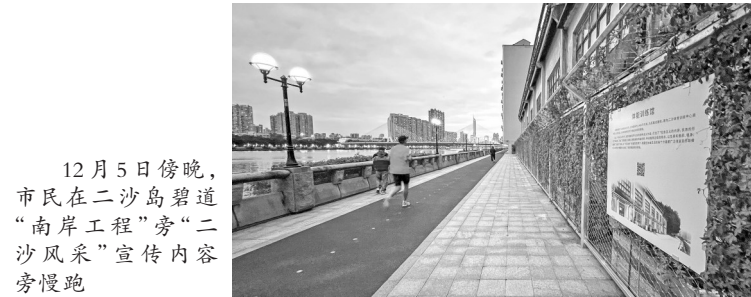
12月5日傍晚,市民在二沙岛碧道“南岸工程”旁“二沙风采”宣传内容旁慢跑

羊城晚报记者12月5日现场所见,南岸工程有多处“上新”。在今年8月对外开放时,管理方仅在靠近颐园文物群区域,设置张贴在玻璃上的解说内容。如今二沙岛体育训练中心也在碧道和训练中心间的护栏处,开设“二沙风采”主题宣传,对公园团、苏炳添、樊振东、全红婵等曾在二沙岛体育训练中心训练过的广