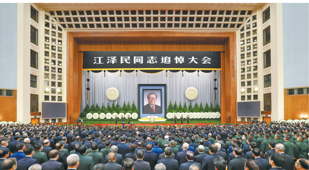
12月6日，中共中央、全国人大常委会、国务院、全国政协、中央军委在北京人民大会堂隆重举行江泽民同志追悼大会