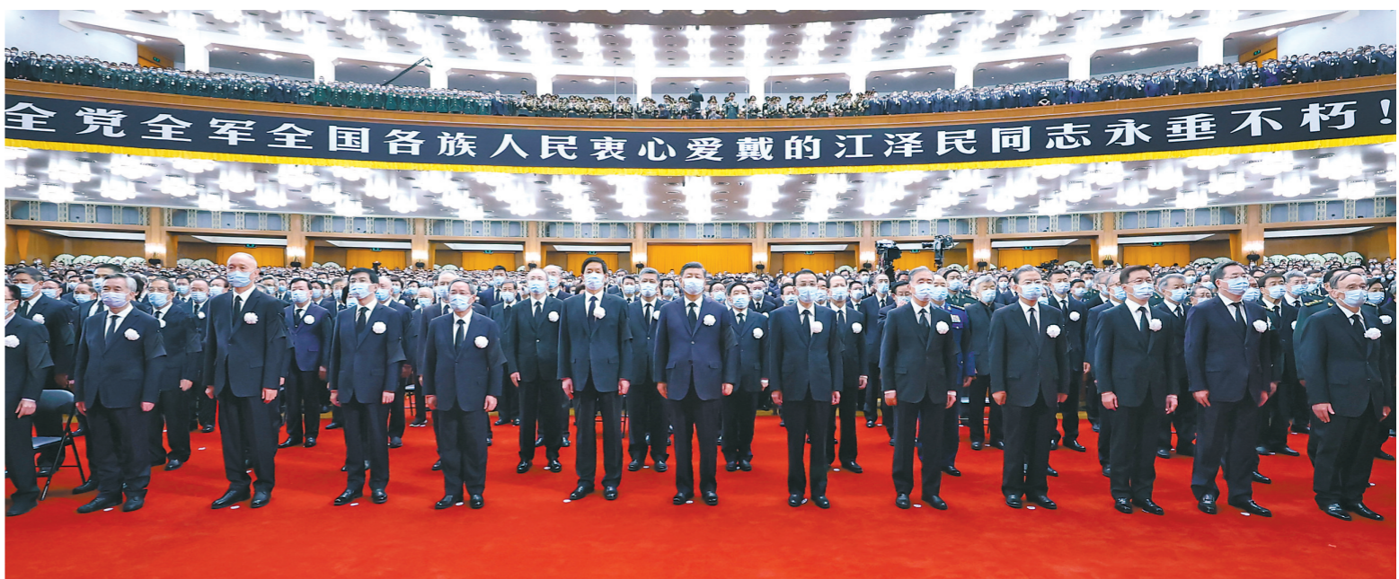
12月6日，中共中央、全国人大常委会、国务院、全国政协、中央军委在北京人民大会堂隆重举行江泽民同志追悼大会。习近平、李克强、栗战书、汪洋、李强、赵乐际、王沪宁、韩正、蔡奇、丁薛祥、李希、王岐山等参加大会