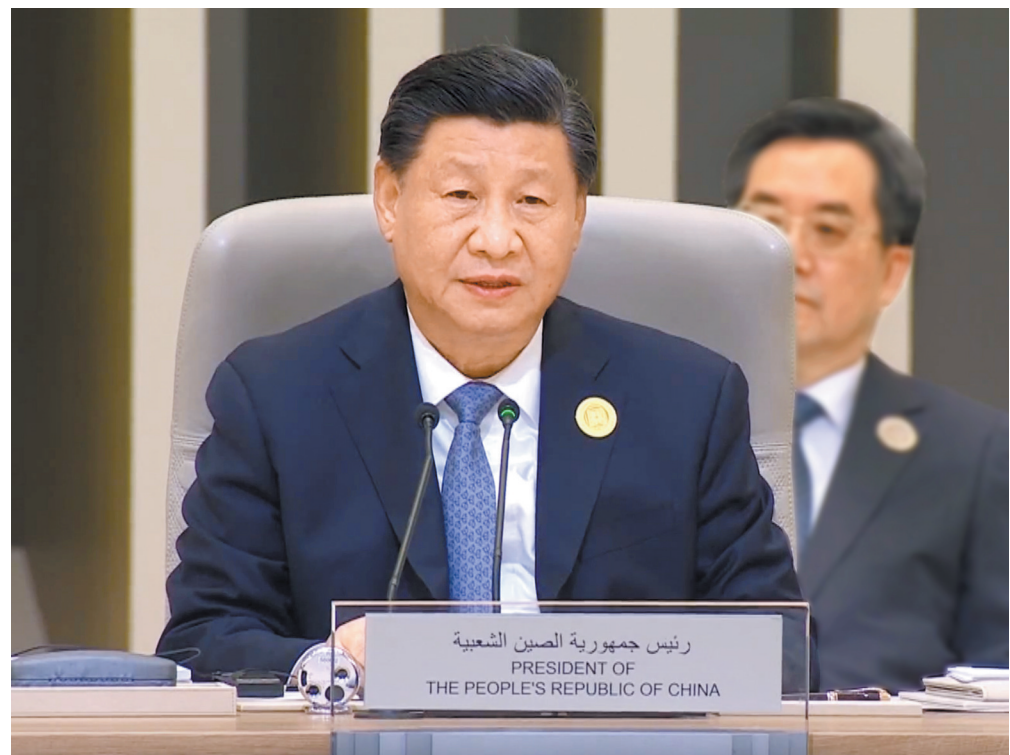
当地时间12月9日下午，首届中国－阿拉伯国家峰会在沙特首都利雅得阿卜杜勒阿齐兹国王国际会议中心举行。国家主席习近平出席峰会并发表题为《弘扬中阿友好精神 携手构建面向新时代的中阿命运共同体》的主旨讲话

强调弘扬守望相助、平等互利、包容互鉴的中阿友好精神，携手构建面向新时代的中阿命运共同体