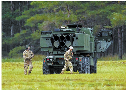
“海马斯”多管火箭系统(资料图)

今年以来,美国已经向乌克兰提供价值近200亿美元的武器装备等军事支持。俄方多次谴责美方做法是在加剧紧张局势,火上浇油。