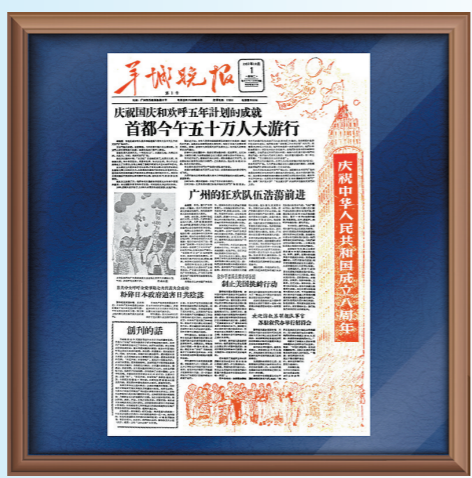
《羊城晚报》创刊号头版数字藏品

羊城晚报讯 记者孙磊、聂粤摄影报道:为深化媒体融合发展,全方位、多渠道地给读者提供各种数字化阅读体验,12月15日,羊城晚报和ZAKER联合运营的数字藏品平台——“羊晚数藏”将正式上线!