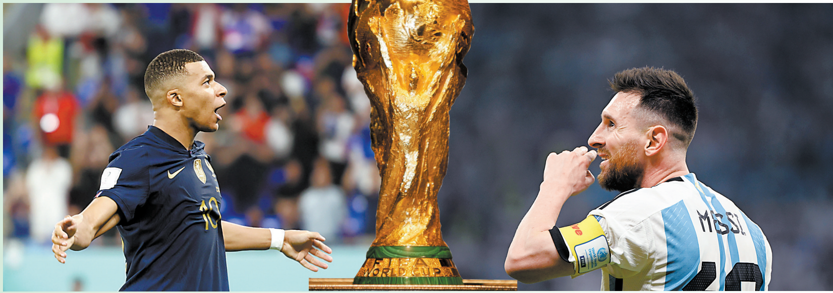
法国队球员姆巴佩