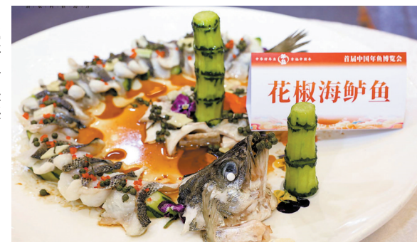
博览会上的年鱼菜品展示