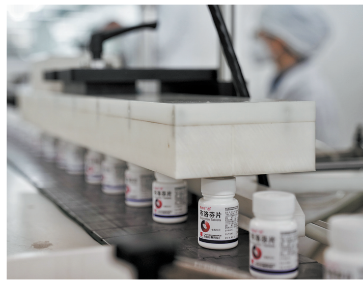
白云山制药总厂开足马力,生产布洛芬片