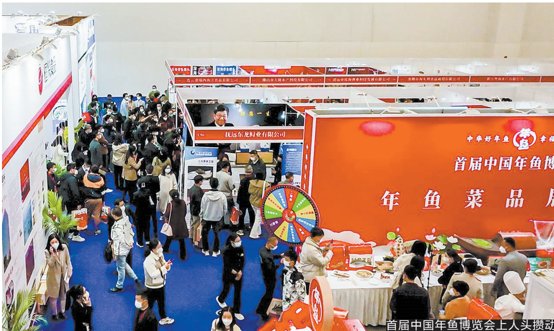
首届中国年鱼博览会上人头攒动

两个月前,广东首提“年鱼经济”概念。时隔两个月,首届年鱼博览会盛大开幕,这便是广东抢抓经济、提振信心的速度。广东省农业农村厅相关负责人表示,广东打造“年鱼经济”、举办年鱼博览会,是构建“百县千镇万村高质量发展工程”的鲜活实践,是落实大食物观,提升农业物质价值、文化价值、情感价值的鲜活实践。以市场为导向,“出道即巅峰”的年鱼正推动广东渔业、广东预制菜产业进一步走宽国内国际市场。