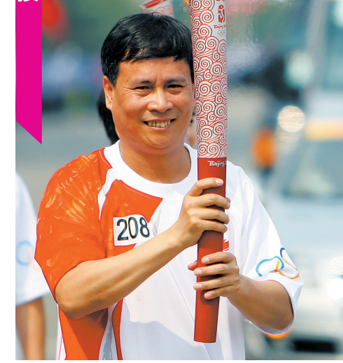
吕钦担任北京奥运火炬手

吕钦生于1962年8月,广东惠东人,象棋特级国际大师,曾获5次象棋世界锦标赛个人和团体冠军,两次亚洲象棋锦标赛个人冠军和8次亚洲团体锦标赛冠军,5次全国象棋个人锦标赛冠军和12次全国象棋团体锦标赛冠军,8次全国象棋甲级联赛冠军,另外多次获得各项杯赛冠军。现任中国象棋协会副主席,广东省象棋协会会长,曾5次获得国家体育运动荣誉奖章,曾获选新中国50周年棋坛十大杰出人物。