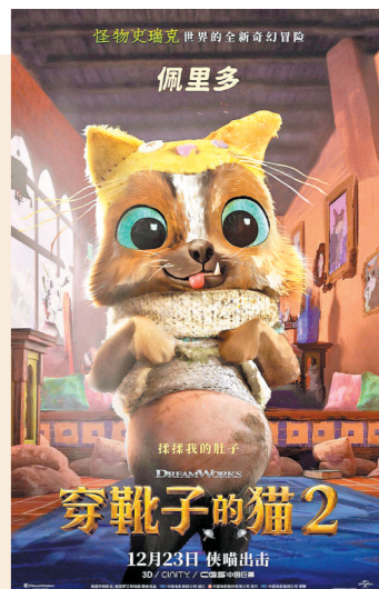
新登场的小狗佩里多

值得一提的是,《穿靴子的猫2》的成功,让人们即将在2025年重启的《怪物史莱克》系列重新燃起了信心。在那之前,人们曾一度认为“史莱克宇宙”已经没啥好盼望的了。但如今,起码人们还想看到靴子猫和软爪吉蒂的下一代呢!