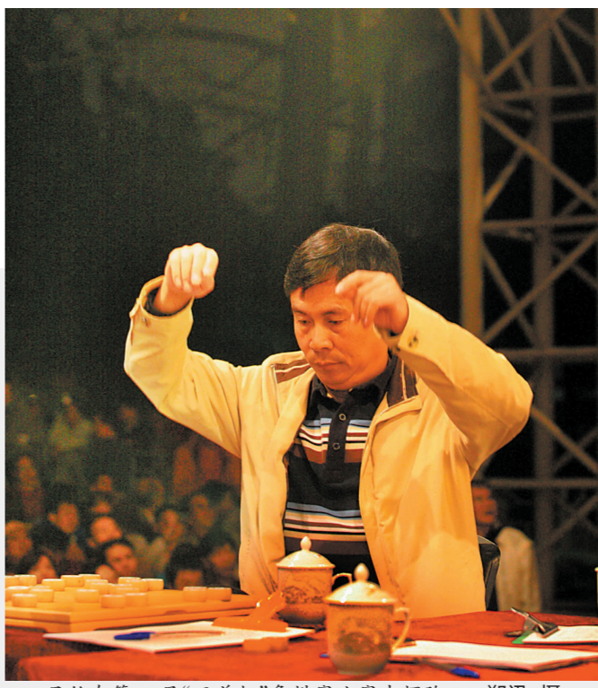
吕钦在第29届“五羊杯”象棋比赛中摆阵

来稿有机会入选刊登于《羊城晚报》和羊城派App,部分文章作者将获得由广东东湖棋院(西关棋院)提供的精美棋具。