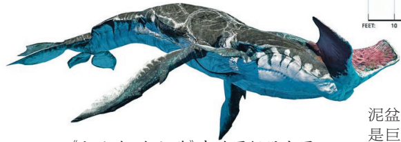
《阿凡达·水之道》中的图鲲设定图

当然，伊鲁也有很多地球的蛇颈龙身上未见的虚构特征，比如多出一对眼睛和鳍状肢，头部两侧伸出来的“触角”等。