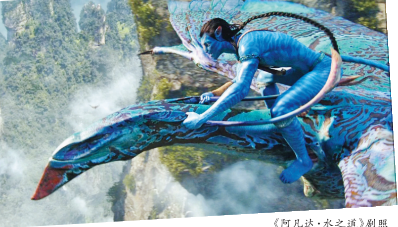
《阿凡达·水之道》剧照