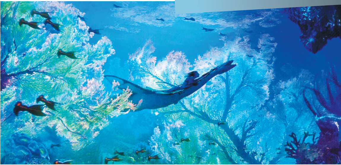
《阿凡达·水之道》剧照

最近《阿凡达·水之道》上映，看到此次剧设背景是潘多拉星球的蔚蓝大海，再看到预告中几个一闪而过的“海中魅影”，海怪爱好者们应该已是激动不已。因为他们可能已经发现，这些海怪们的真实面目曾经真的出现在地球上。