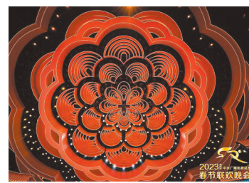
晚会舞美设计体现“满庭芳”的理念