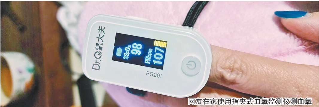
网友在家使用指夹式血氧监测仪测血氧

人数超过了27万，支付金额达445余万元，在线商品数为8351个。在广州，各大药店、百货商超中带有监测血氧功能的仪器及手表等，均在近期出现了销售高峰。 市面上各类或主打或附带监测血氧功能