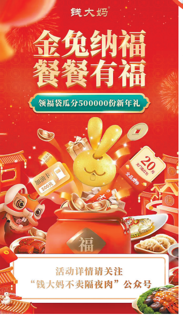
钱大妈年货节“餐餐有福”

临近兔年春节,当你走进“家门口的菜市场”钱大妈,买肉菜、办年货、购礼盒的街坊们络绎不绝,在这个装饰得红红火火的生鲜小店里,欢天喜地的购物气氛让人不由自主地心情愉悦起来。在钱大妈门店里,正在以热闹非凡、熙熙攘攘的生活场景,给社区点缀热闹、温暖、幸福、吉祥的新春年味,欢愉的喜气从每一个街坊的脸上流露出来。钱大妈用1900多家布置得年味十足的社区门店,为消费者送来了新春暖意。