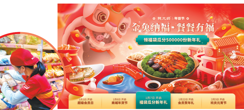
钱大妈年货节“餐餐有福”